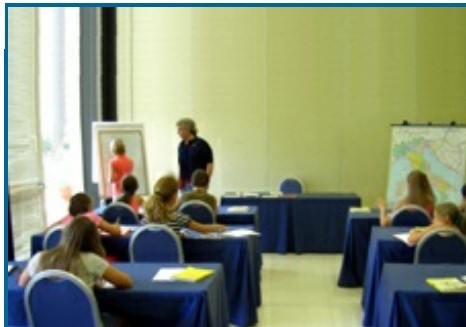
Il corso di lingua e cultura italiana presso il Nicotel di Castellaneta Marina

Allo stage hanno preso parte tredici al-lievi del Centro di Formazione N° 1409 di Mosca, giunti in Italia accompagnati da una docente dell'istituto. Nell'ambito del gruppo giunto a Taranto per la >